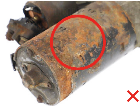
Fehlendes / unleserliches Etikett / nicht identifizierbares Teil