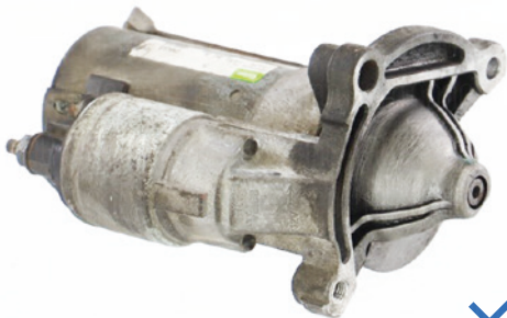
Komplettes Teil ohne fehlende Teile oder Beschädigungen