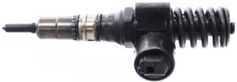
Komplettes Teil ohne fehlende Teile oder Beschädigungen