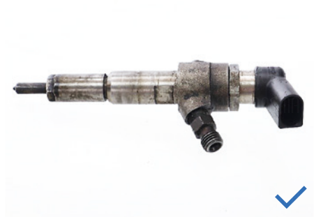
Komplettes Teil ohne fehlende Teile oder Beschädigungen