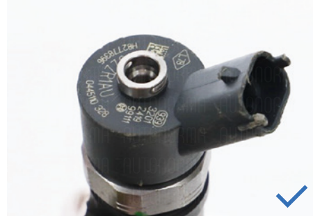
Elektrischer Stecker ohne Beschädigung